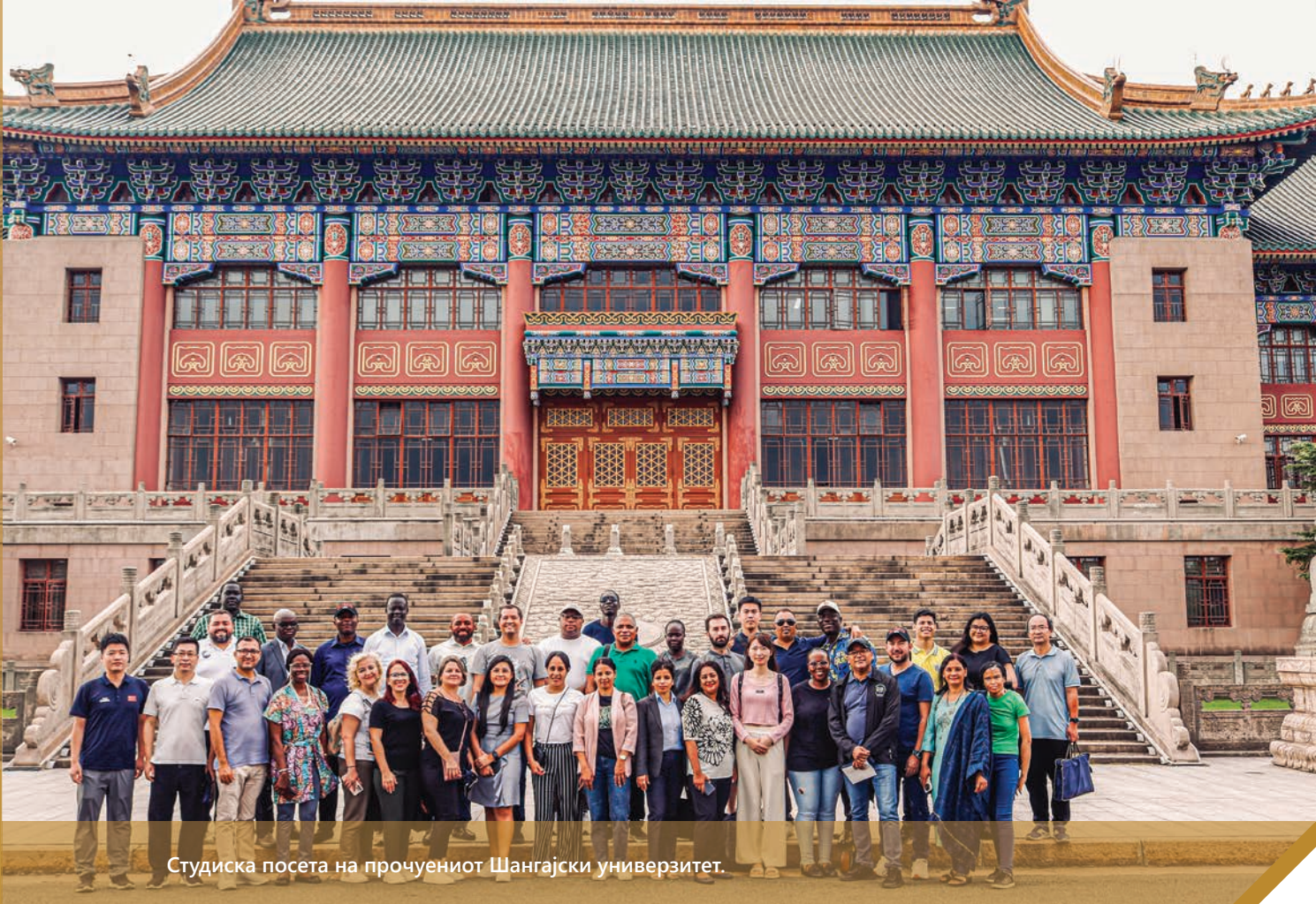
Студиска посета на прочуениот Шангајски универзитет.