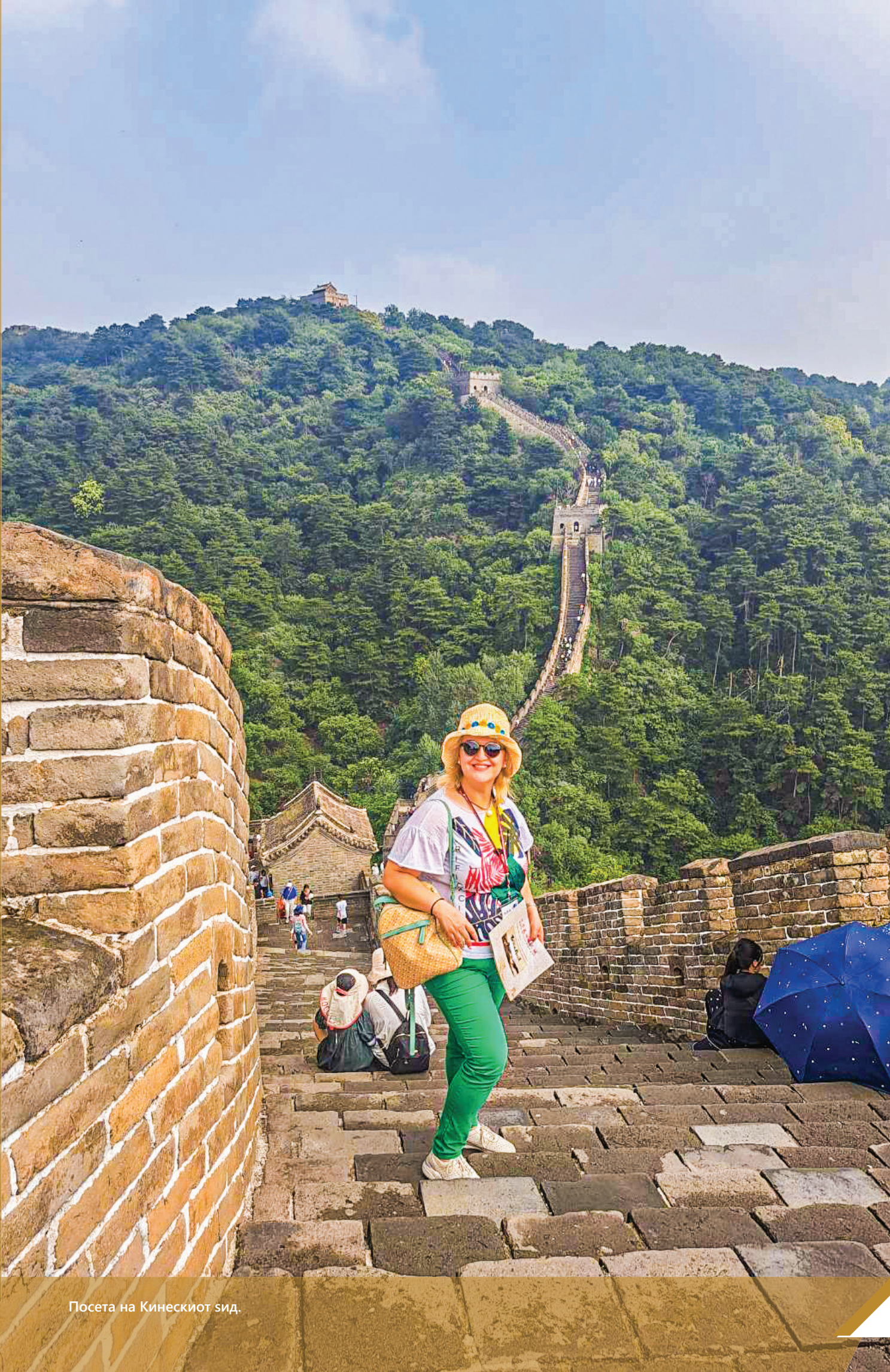
Посета на Кинескиот ѕид.