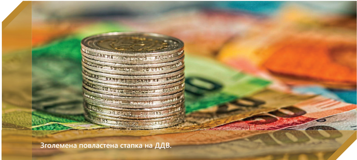
Зголемена повластена стапка на ДДВ.