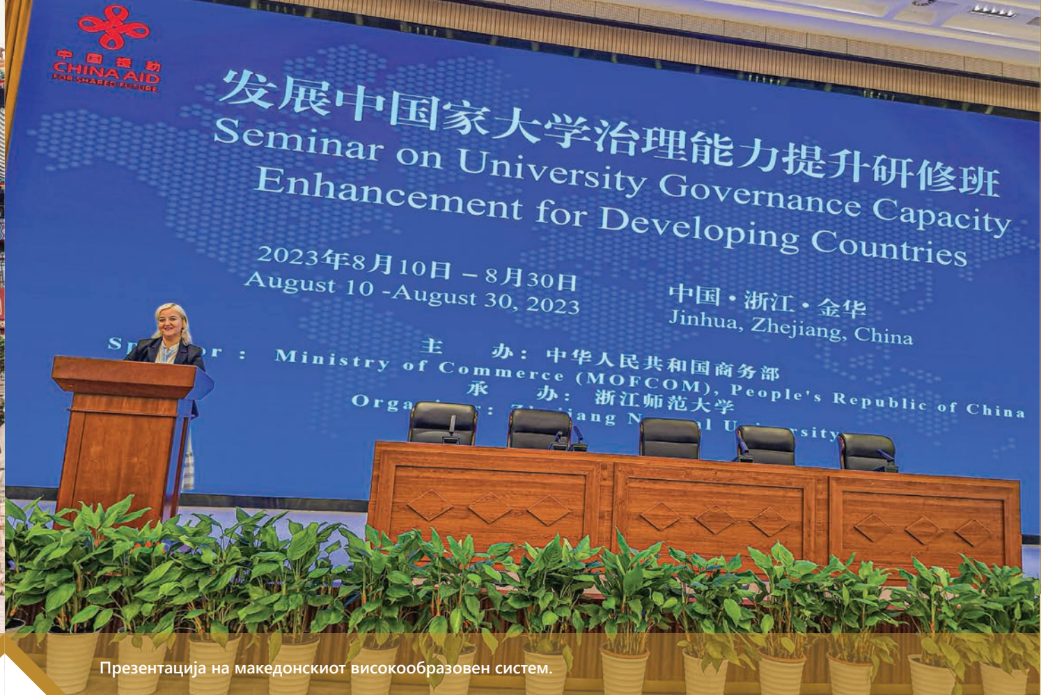
Презентација на македонскиот високообразовен систем.

инвестиции во високото образование и од аспект на инфраструктура и од аспект на ресурси. За време на мојата посета, имав можност од прва рака да посведочам за динамичната природа на кинеските високообразовни институции. Со фокус на подобрување на квалитетот на образованието и на истражувачките капацитети на своите универзитети, Кина има направено огромни чекори и значителен прогрес во профилирањето квалитетни кадри, кои од друга страна придонесоа за подобрување на економската конкурентивност на државата. Колеџите и универзитетите денес нудат врвна технологија за брзи железници, нуклеарна енергија, развој на вакцини, национална безбедност и за останати клучни области и активно учествуваат во развој на супер-компјутери, на сателитскиот систем Бејду и на вселенските летала Шенџу. Ова е јасен индикатор дека образовните реформи во државата се докажале како доста успешни. Една од најклучните лекции за сите нас беше улогата на кинеската влада во обликувањето на политиките за високото