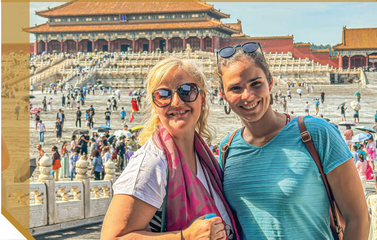
Туристичка посета во Забранетиот град.