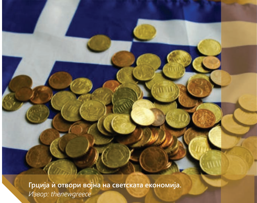
Грција ѝ отвори војна на светската економија.

Земјата главно ќе се залага за поширока и поефикасна употреба на технологијата во трансакциите (на пр. проширување на ПОС на сите економски активности, завршување на меѓусебната поврзаност на фискалните каси со ПОС, задолжително објавување на приходите и расходите, казни за користење готовина над 500 евра и забрана за користење готовина во трансакции со недвижности), како и проширување на даночната основа (на пр., промени на краткорочни закупи со воведување данок на живеалиште од 1,5 евра на ден и ДДВ за оние кои изнајмуваат три или повеќе имоти и одредување праг на даночната добивка што треба да ја покажат хонорарците).