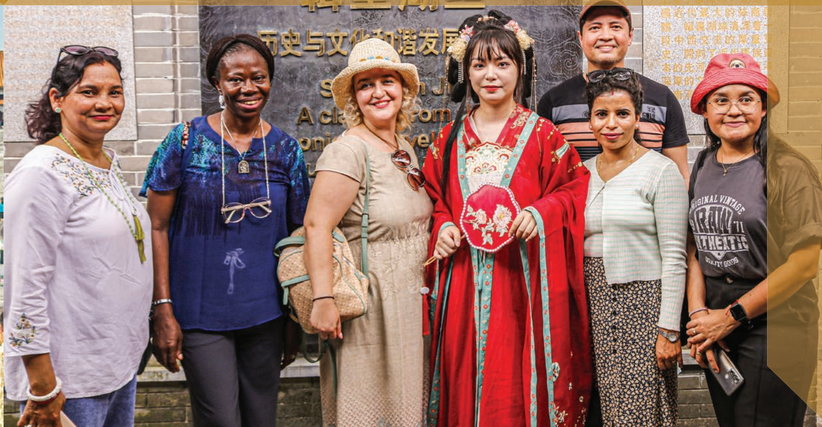
Традиционална кинеска невеста.