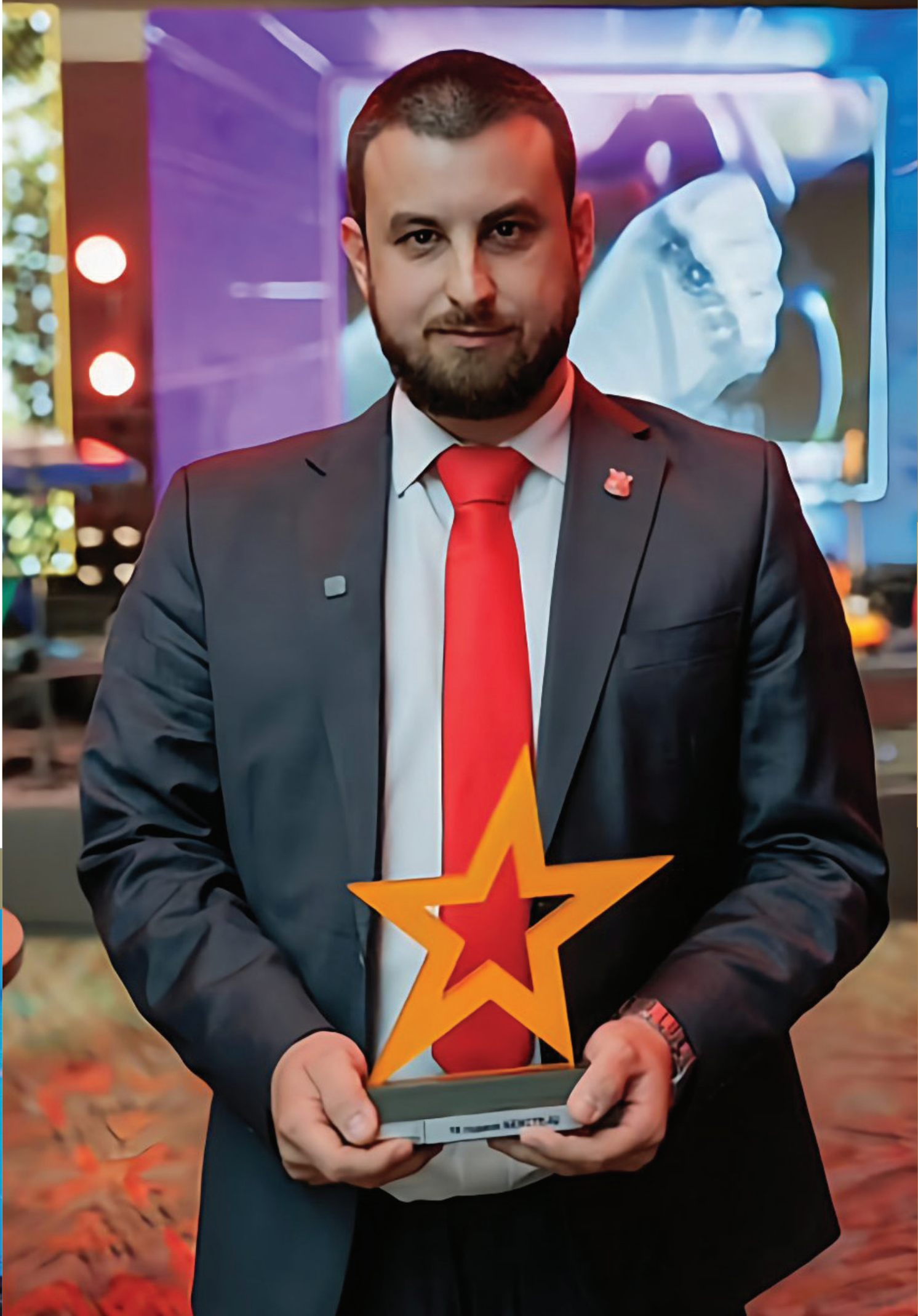
Миленковски: „Патот не е лесен, но задоволството е големо кога се поддржува нашата Македонија.“