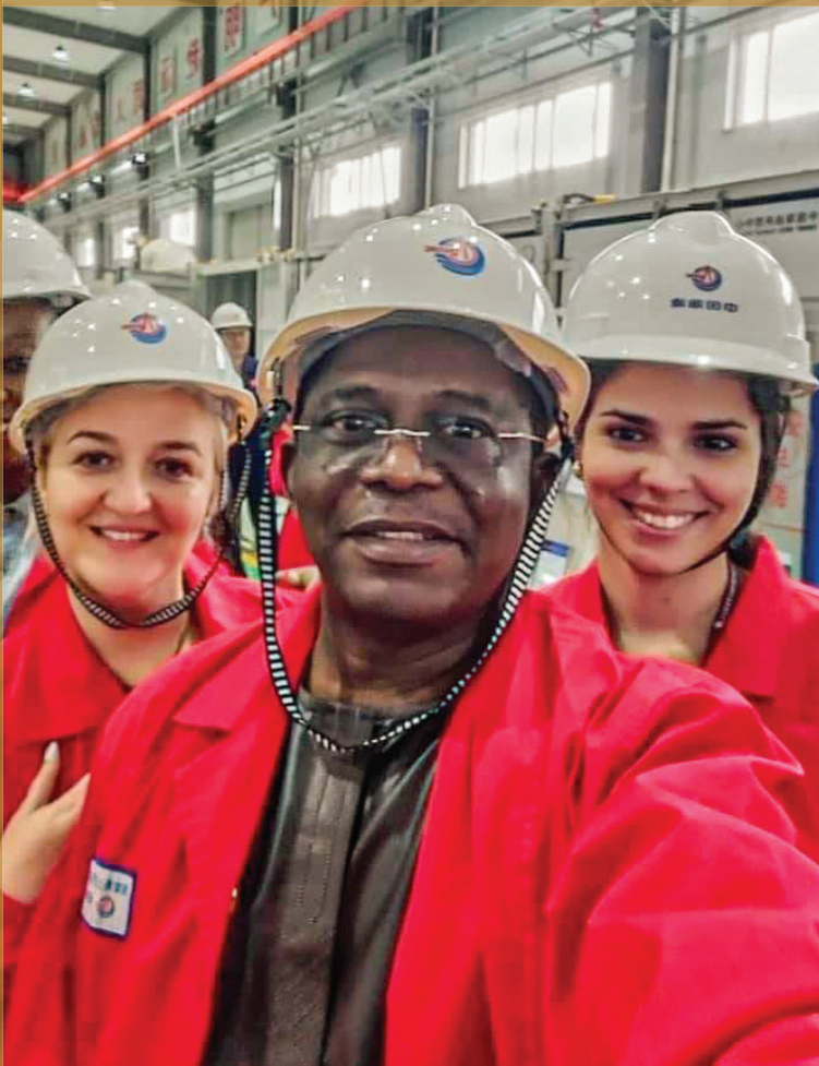
Едукативна посета на нафтни платформи во Тианџин, Кинеско Море.

на земјата да негува глобално конкурентни кадри кои иако ги прифаќаат иновациите и напредокот, остануваат длабоко поврзани со мудроста на своето културно наследство. Кина е држава на најголемиот образовен систем во светот. Инвестициите во образованието изнесуваат околу 4% од вкупниот БДП на државата. Кина има повеќе од 2.500 високообразовни институции и има направено значителен прогрес во однос на пристапот до високото образование, со што само во 2021 година има продуцирано над 9 милиони дипломирани студенти. Кинескиот образовен систем има претрпено значителна трансформација во последните децении. Брзата експанзија и интернационализација на нејзините универзитети беа камен-темелник на нејзината образовна ренесанса. Ваквиот раст на високообразовните институции на земјата е мотивиран од многубројни фактори, меѓу кои можеби најзначајна е силната државна волја и политика да развие економија базирана на знаење и да го подобри човечкиот капитал на земјата. Сето ова е постигнато со огромни