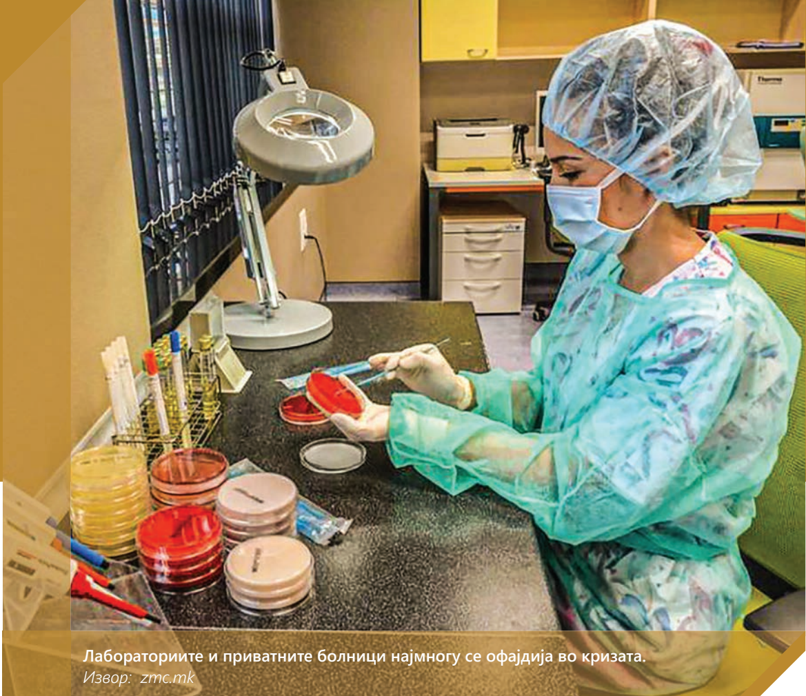
Лабораториите и приватните болници најмногу се офајдија во кризата.