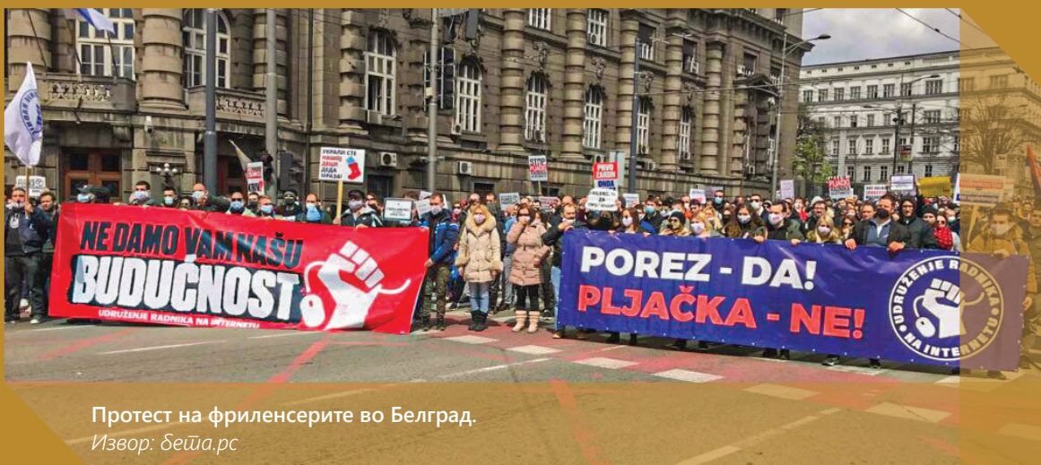
Протест на фриленсерите во Белград.

Втората категорија е дел од пошироката даночна реформа, каде што проширувањето на даночната основа ќе ѝ овозможи на владата да го намали (тековното) прекумерно оданочување на наемниот труд. За да го направи ова, Министерството за национална економија и финансии го наметнува импутираното оданочување на хонорарците, со тоа што како граница на оданочливата добивка ја утврдува бруто-заработката од минималната плата, која изнесува 10.920 евра.