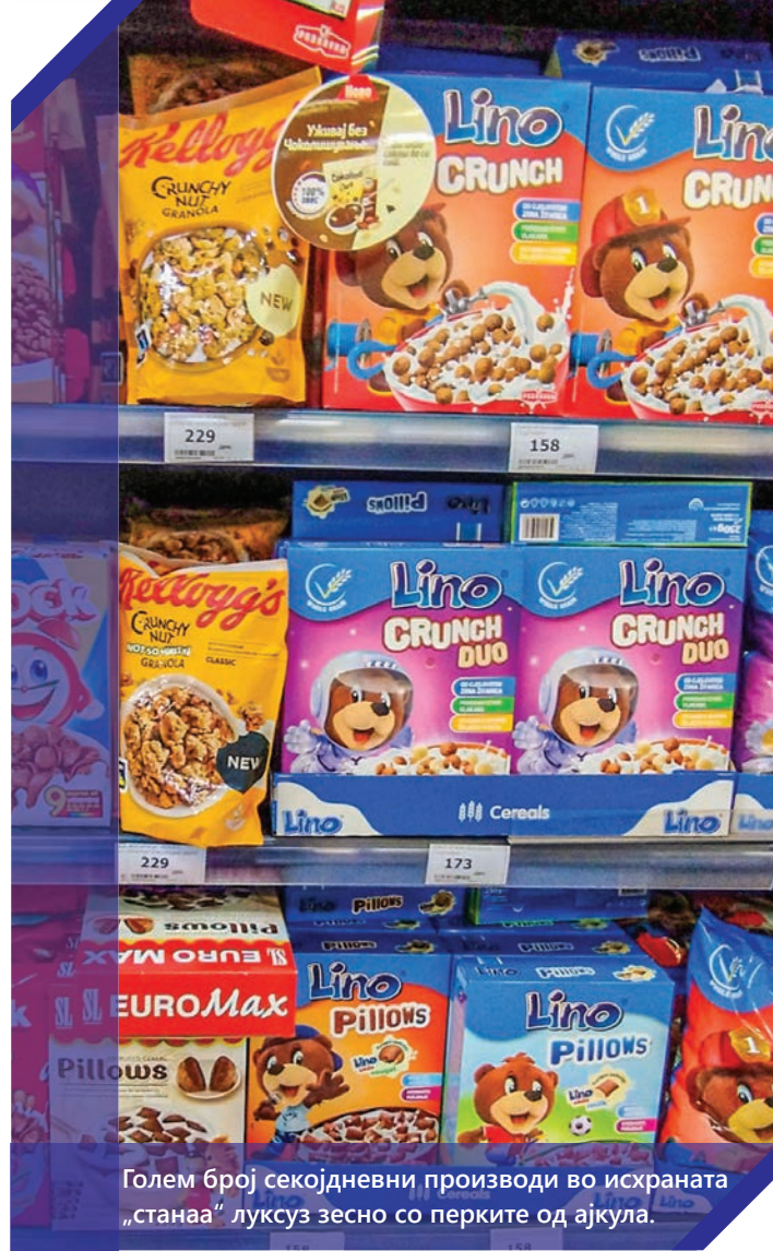
Голем број секојдневни производи во исхраната „станаа“ луксуз зесно со перките од ајкула.