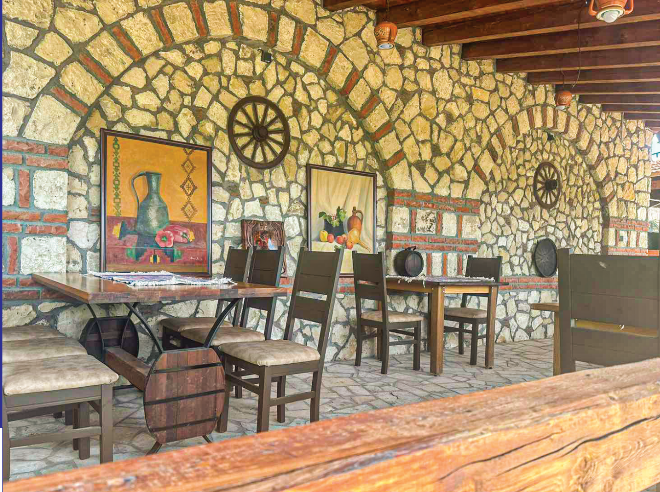
„Златно буре“ е изграден во традиционален македонски стил.

Ресторанот овозможува пријатен престој особено во текот на летните горештини.