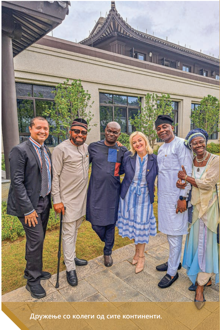
Дружење со колеги од сите континенти.

и истражување е од клучно значење за градењето силна академска основа. Мојата студиска посета на Кина беше искуство што ги отвора очите. Посветеноста на Кина за унапредување на високото образование и на неговите структури на управување се навистина пример за светот. Разгледувајќи го искуството на Кина во реформите во високото образование и длабокото влијание на Конфучие и на неговото наследство во овој процес, станува очигледно дека има многу да се научи од оваа богата историја. Определбата на Кина да ги искомбинира традицијата и модерноста во својот пристап кон високото образование е вредна лекција за глобалната академска заедница. Тоа е доказ за важноста од зачувување на културните вредности и етика при прифаќање на напредокот и на иновациите. Нам, разгледувањето и усвојувањето на најдобрите практики во високото образование може да ни даде мотив и инспирација за создавање поинклузивен, етички и глобално конкурентен академски систем. Само во таква рамка на размена на знаења и идеи ќе имаме можност да создадеме посветла иднина за високото образование дома и во светот.