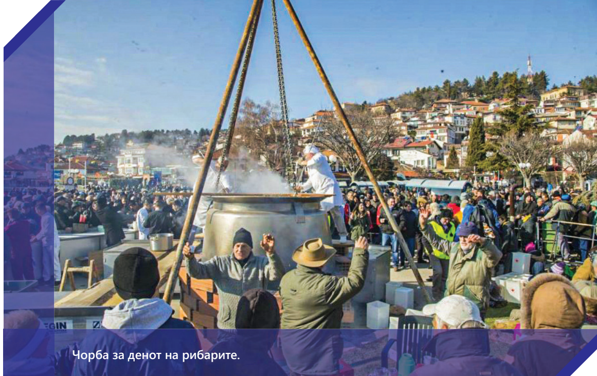
Чорба за денот на рибарите.

карактеристична за трпезите на овој празник.