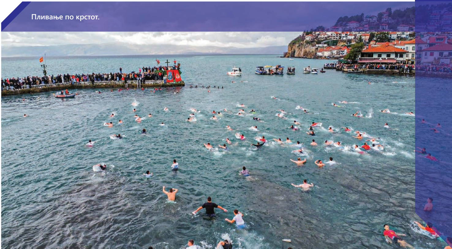
Пливање по крстот.

Традиционалното капење на рибарите и годинава ќе се одржи на месноста „Сараиште“ и истата ќе биде надополнета со повеќе културни и забавни содржини. Оваа година ќе биде послужена и храна која е