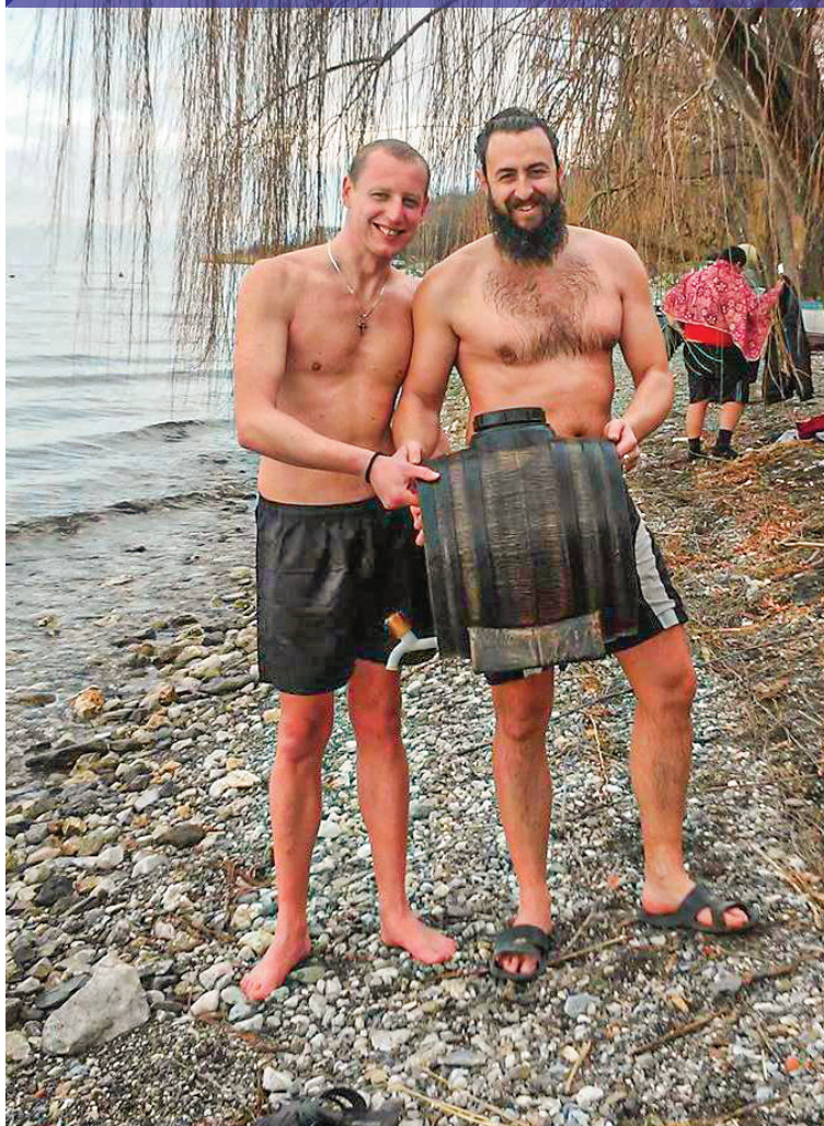
Фаќање буре во Пештани.

Смета дека скромноста на овој и тоа како важен ден во православието треба да биде доблест за секој христијански верник.