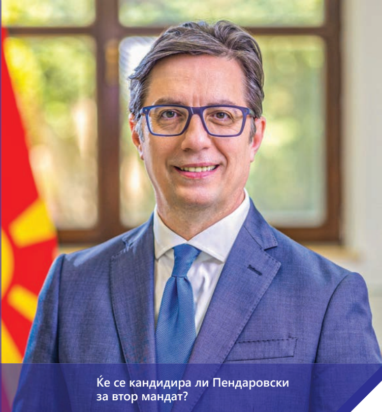
Ќе се кандидира ли Пендаровски за втор мандат?