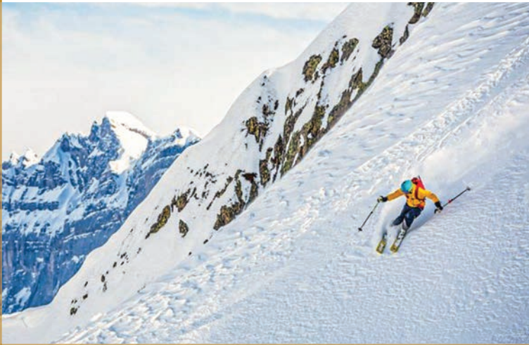
Шамони, Франција.