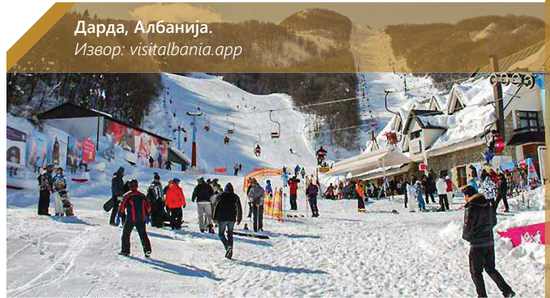
Дарда, Албанија.