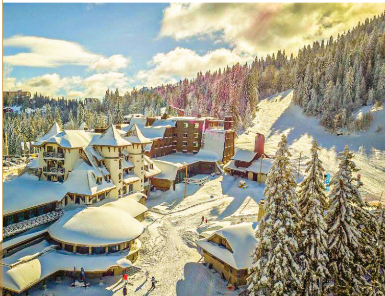
Јахорина, Босна и Херцеговина.