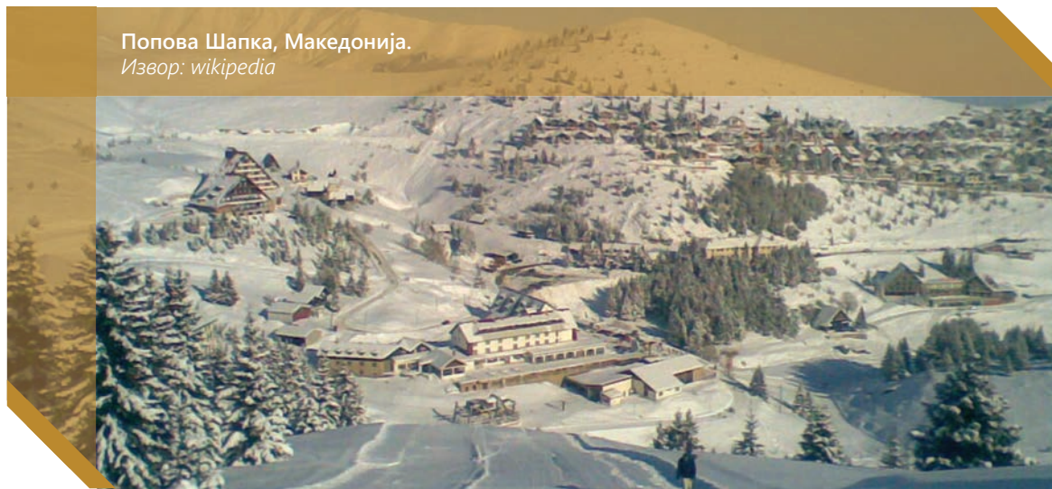
Попова Шапка, Македонија.

Иако во тек е зимската сезона, сè уште нема никакви активности од најавените инвестиции на италијанската компанија Техно Алпин која според властите уште изминатава пролет требаше да инвестира на Попова Шапка.