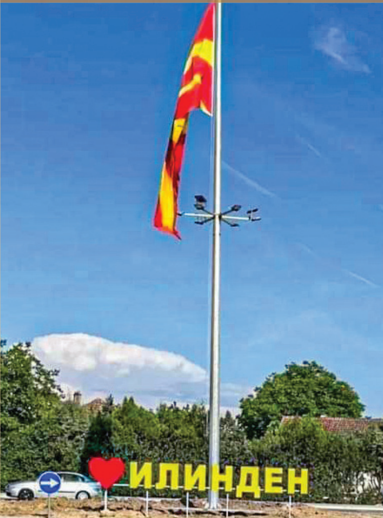
Препознатливиот симбол на Општина Илинден.

Зошто досега се чекало, не би можел да одговорам, но факт е дека откако сум јас на функцијата како градоначалник, интензивно работиме на подобрување на безбедноста во сообраќајот и секојдневната комуникација на луѓето. Само во текот на минатата година извршена е изградба, реконструкција, санација и рехабилитација на околу 80 локални улици, патишта, пешачки патеки во должина од околу 19.800 метри. Во насока на зголемување на безбедноста во сообраќајот изградивме и нов кружен тек на влезот во општината, со што се реши сообраќајниот метеж во овој фреквентен дел. Би ја издвоил и реконструкцијата на локалниот пат Илинден-Хиподром, кој е од големо значење за жителите, затоа што ја поврзува Општина Илинден со Градот Скопје, со локалната економска зона и е главна