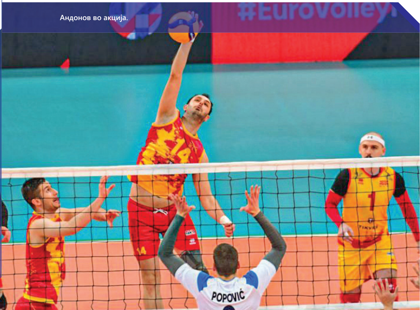
Андонов во акција.