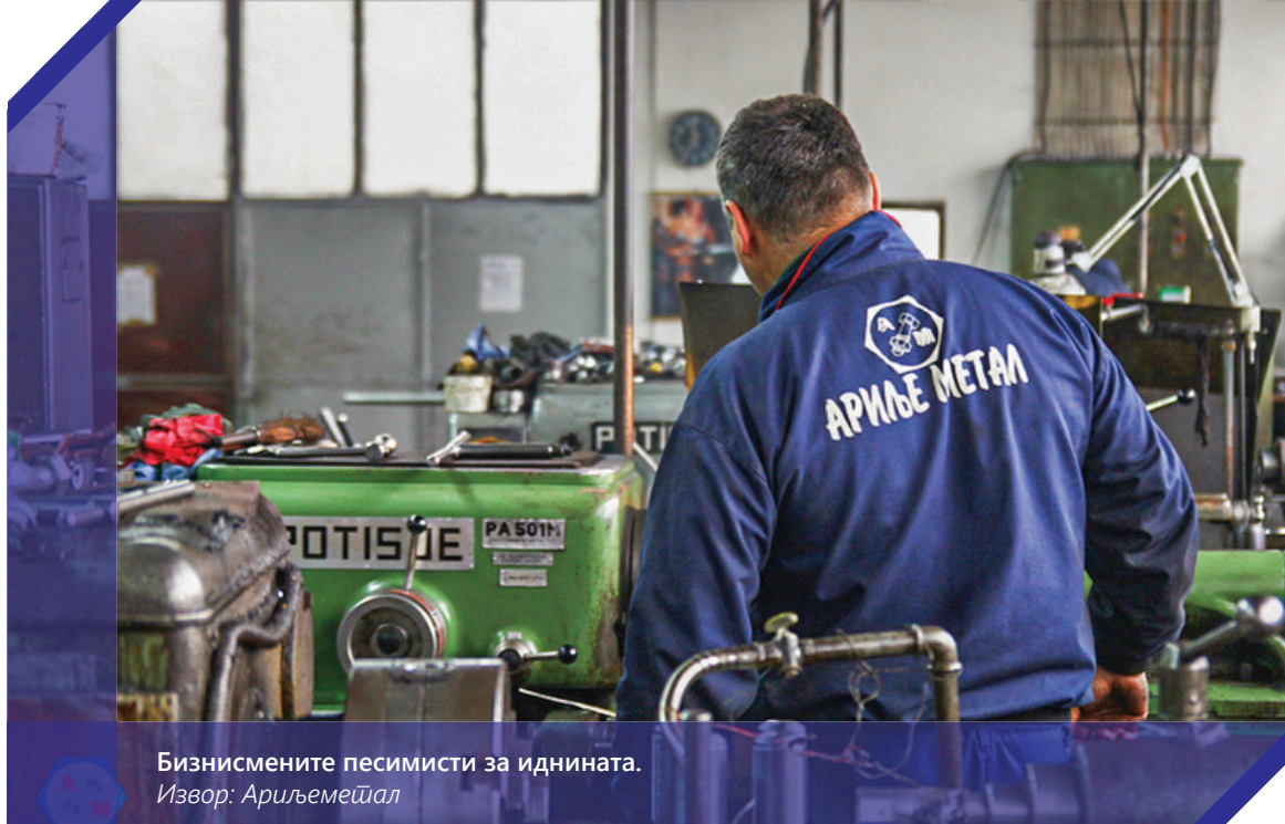
Бизнисмените песимисти за иднината.