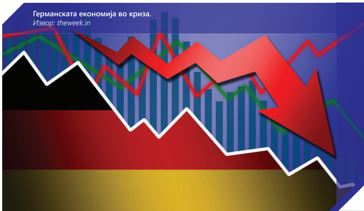
Германската економија во криза.

„Јас постојано кажувам дека извозот треба да биде алфа и омега на нашата економија и тука државата мора повеќе да се ангажира и да даде поддршка. Понатаму, инфраструктурата. Без инфраструктура нема развој, нема нови инвестиции, нема нови вработувања и со тоа нема економски напредок. Понатаму, како држава се соочуваме со некавалитетен систем на образование, што предизвикува недостаток на квалификувана работна сила. И овој проблем станува сè повидлив со годините. Лично ме загрижува зашто не гледам дека државата нешто презема на тој план. Во нашиот систем ни недостасува и владеење на правото. Ни недостасуваат и сериозни мерки за сузбивање на