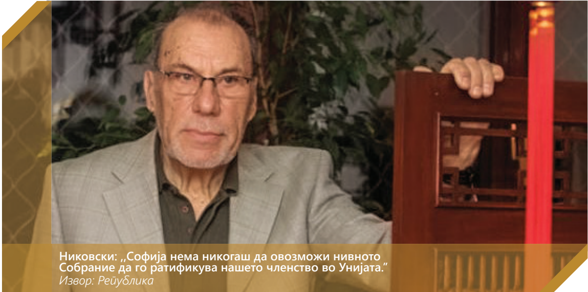
Никовски: „Софија нема никогаш да овозможи нивното Собрание да го ратификува нашето членство во Унијата.“

Судскиот совет, кој мора да биде лика и прилика за правосудниот систем, а е во хаос. Сè додека не расчистиме, генерално, со ендемската корупција, никогаш нема да се приближиме до ЕУ.