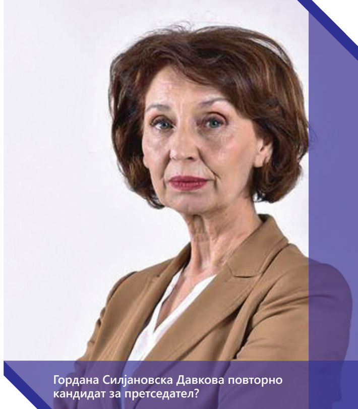
Гордана Силјановска Давкова повторно кандидат за претседател?