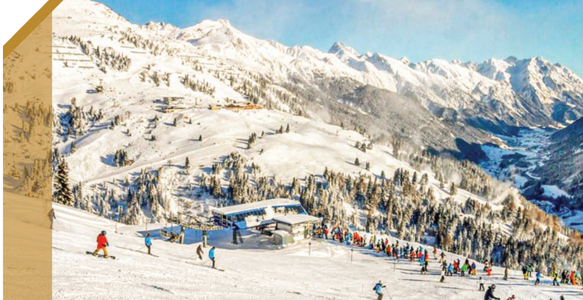
Сент Антон, Австрија.