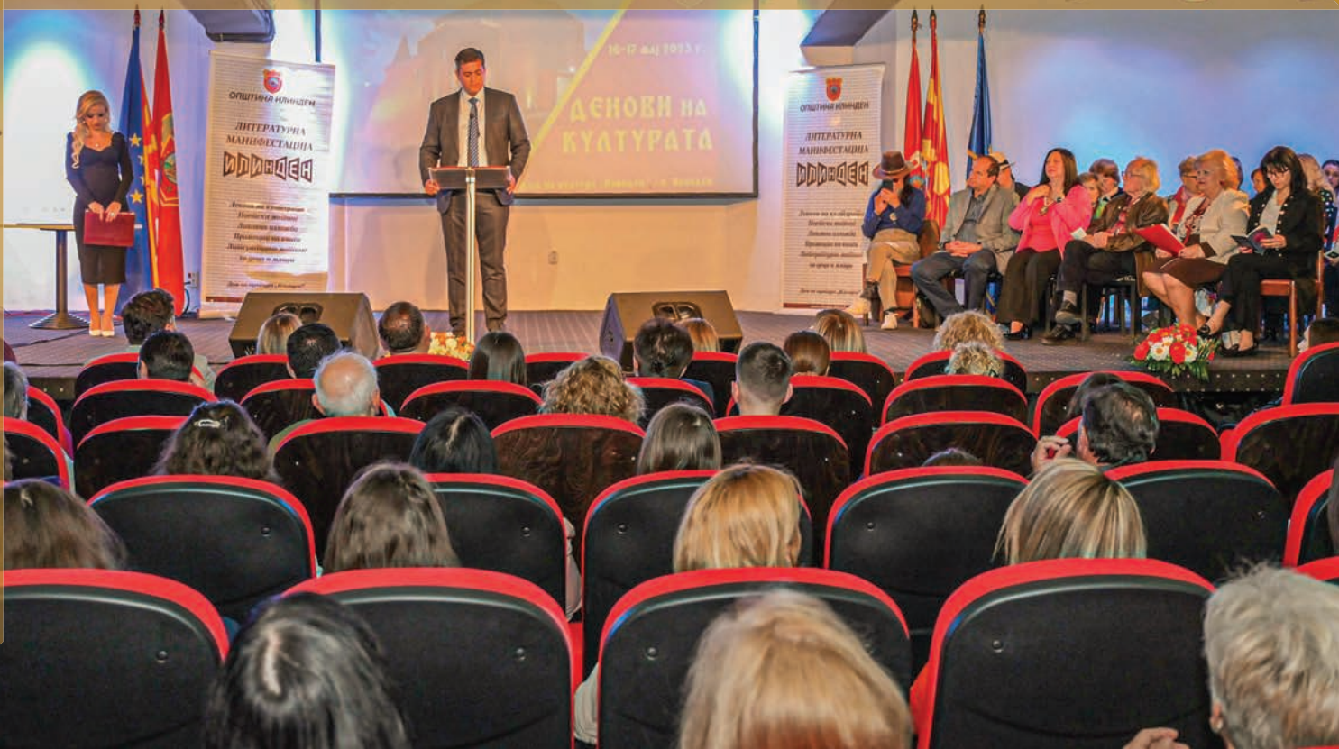
„Денови на културата“ во Општина Илинден.

Изминатиот период беше навистина предизвикувачки ако се земе предвид дека наследивме многу тешка финансиска состојба, на која дополнително се надоврза и една од најтешките економско-енергетски кризи во последниве неколку декади. Затоа се насочив кон консолидација на општината и јавните комунални претпријатија и со заеднички сили со мојот тим во администрацијата, менаџментот на јавните претпријатија и јавните институции како и со успешната