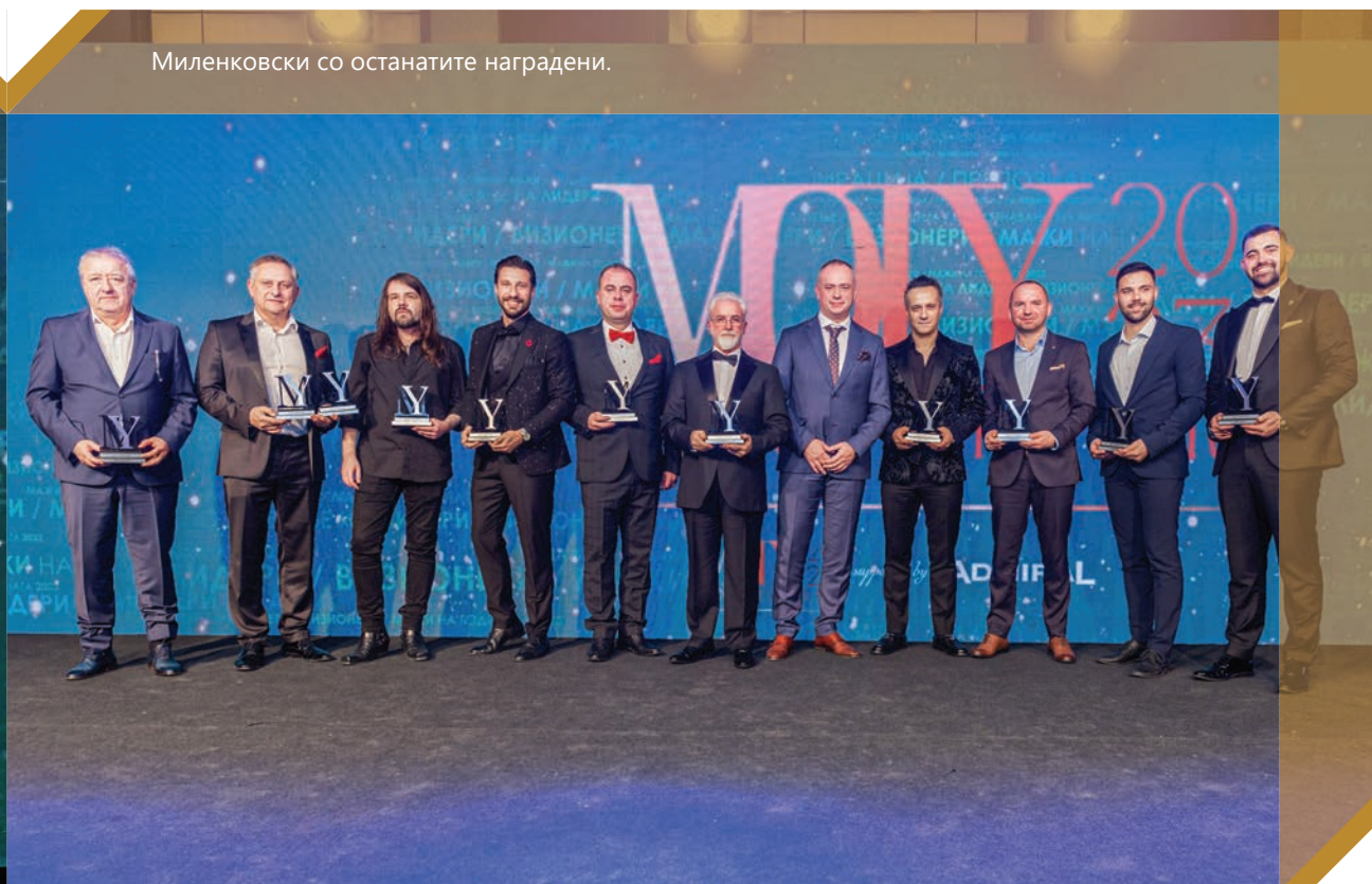
Миленковски со останатите наградени.

bleTree by Hilton Skopje“, награди добија тринаесет најуспешни мажи во Македонија што оставиле белег во нашето општество преку своите достигнувања во 2023 година. Манифестацијата „Мажи на годината“ е во организација на „Фрајдеј комуникации“.