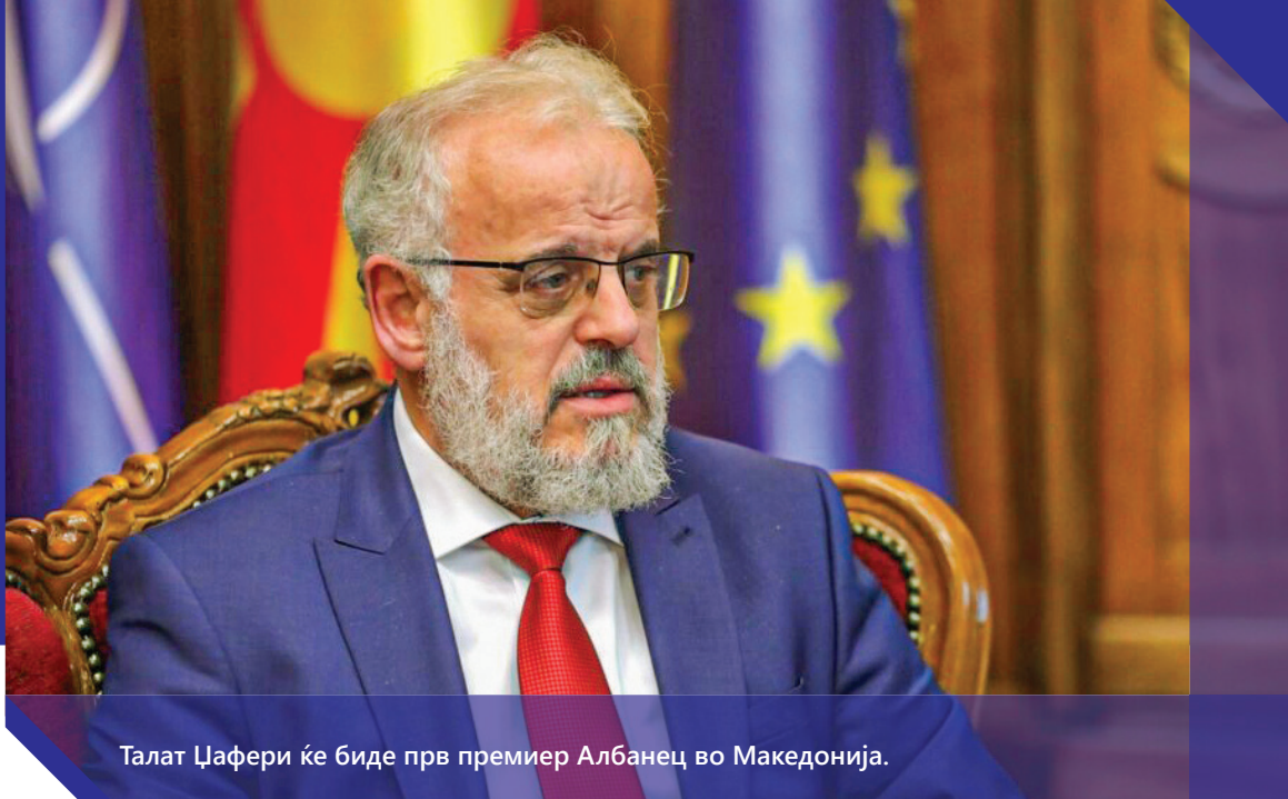
Талат Џафери ќе биде прв премиер Албанец во Македонија.