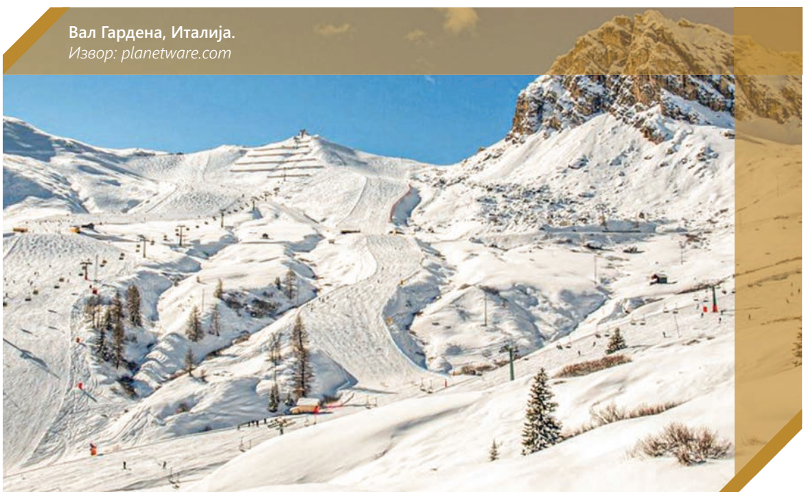
Вал Гардена, Италија.

Ронда. Ски-центарот се состои од два дела, Вал Гардена и Алпе ди Сиуси, поврзани со една ски карта и автобуска врска. Голем број дополнителни содржини, патеки за крос-кантри скијање на работ на Св. Кристин и Ортисеи и уште многу објекти за секаков вид забава, рекреација и добра кујна.