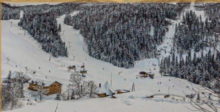
Колашин, Црна Гора.