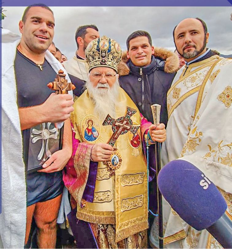
Среќниот фаќач на крстот.

Некои на овој ден се тркаат по буриња вино, некои само ја пеат „Во Јордание“. Црквата стои на ставот дека трката по бурето полно со вино не спаѓа во традиционалните црковни обичаи за празникот и нивни претставници нема на овој чин.