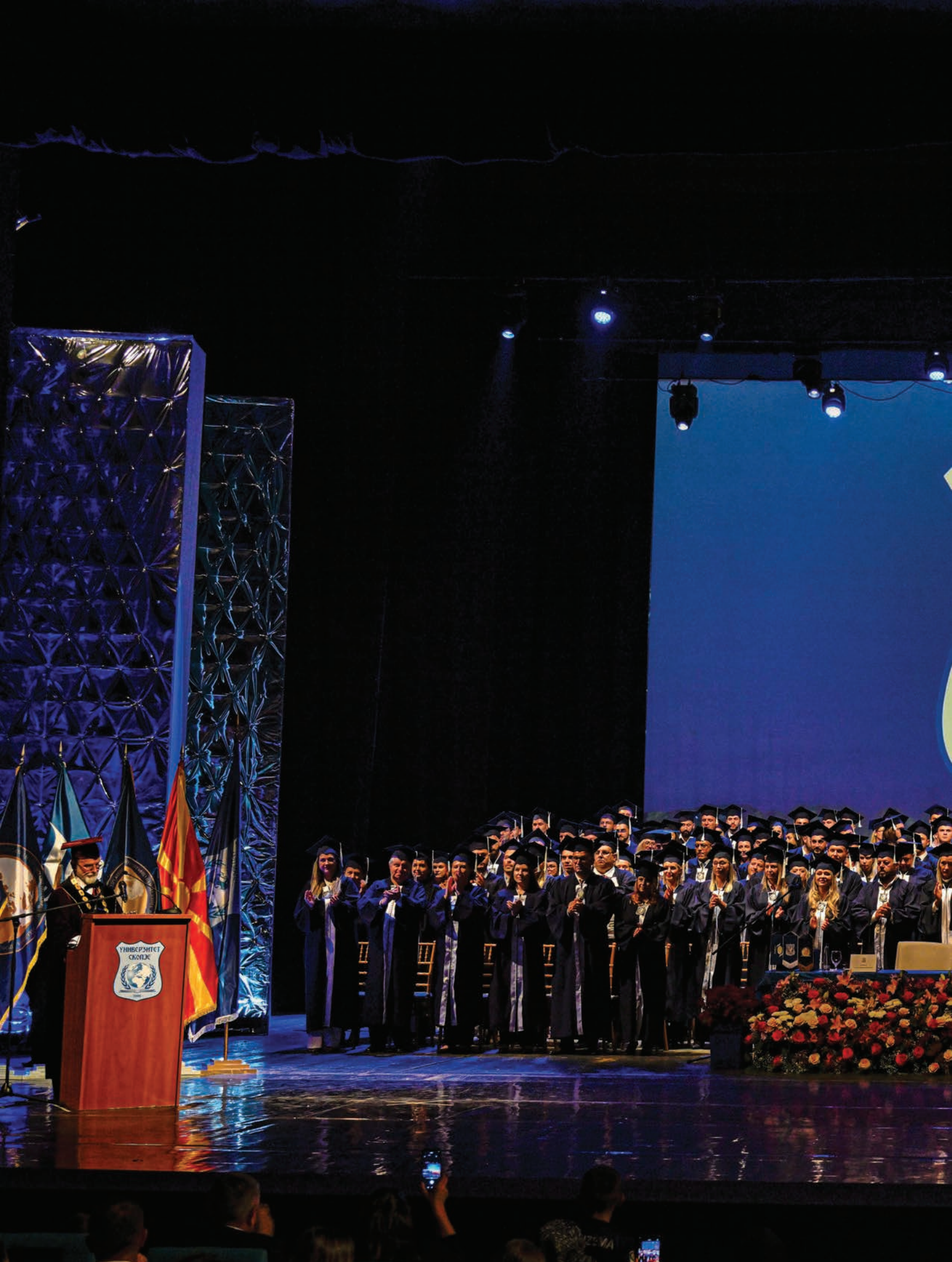
Промоција на додипломци и последипломци на Универзитетот Скопје.