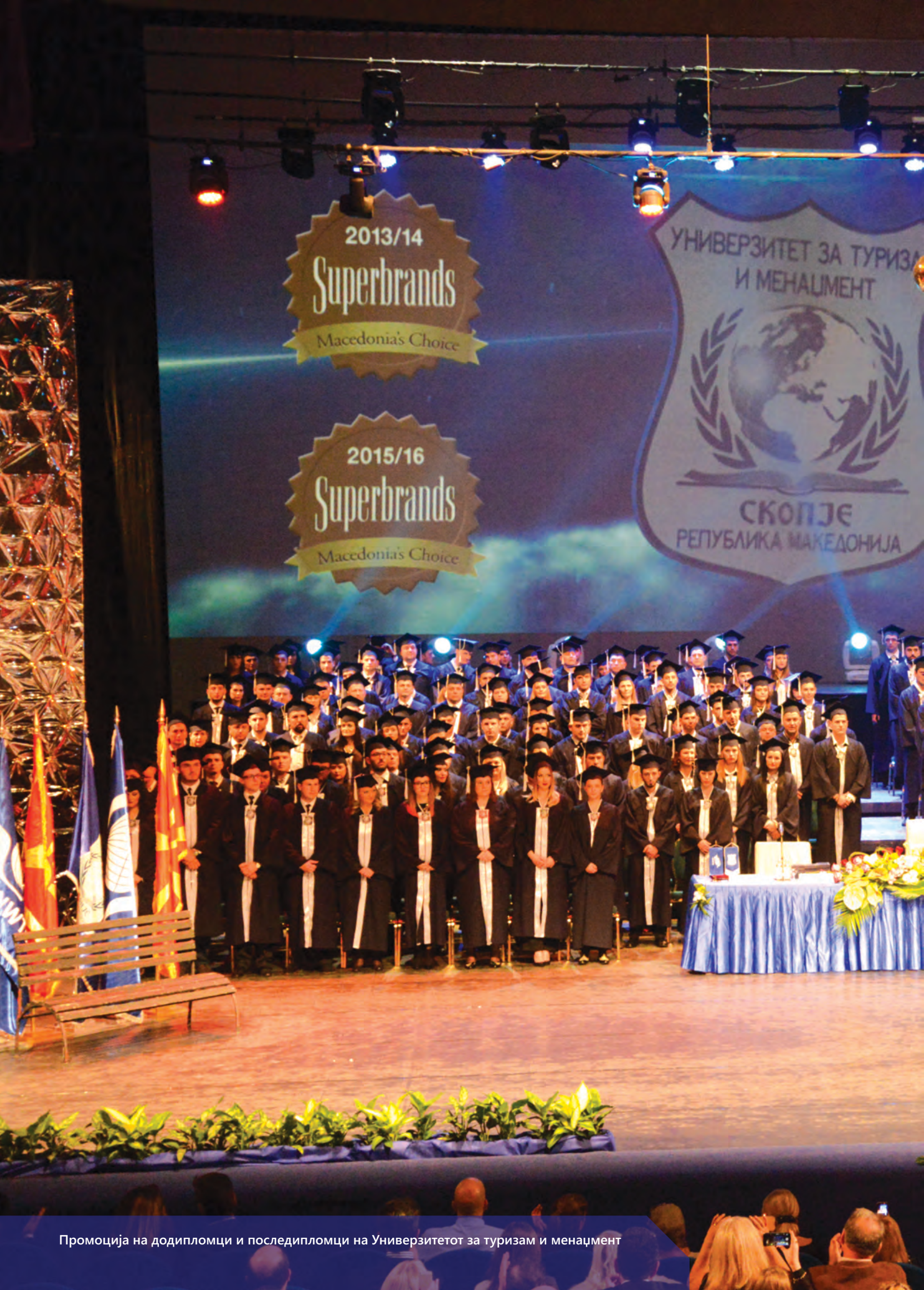
Промоција на додипломци и последипломци на Универзитетот за туризам и менаџмент