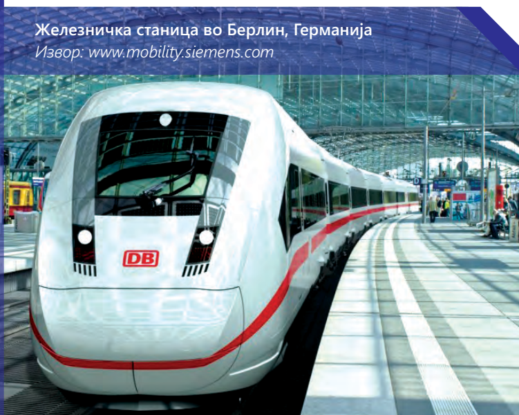
Железничка станица во Берлин, Германија

Во истиот квартал и во споредба со истиот период лани, во Летонија имало 12% помалку патници, во Хрватска е забележан пад од 3%, а во Чешка од 1%.