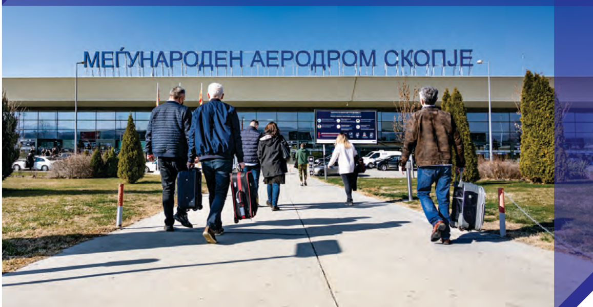
Меѓународниот аеродром во Скопје

Да се надеваме дека почнатиот процес на укинување на сложените рестрикции поврзани со пандемијата ќе влијае позитивно врз зголемување на авионските патувања. Веруваме и дека позитивниот тренд на авионски патувања, поддржан од моменталниот процес на укинување на сложените рестрикции за патување наметнати од различните држави, ќе продолжи и во следниот период.