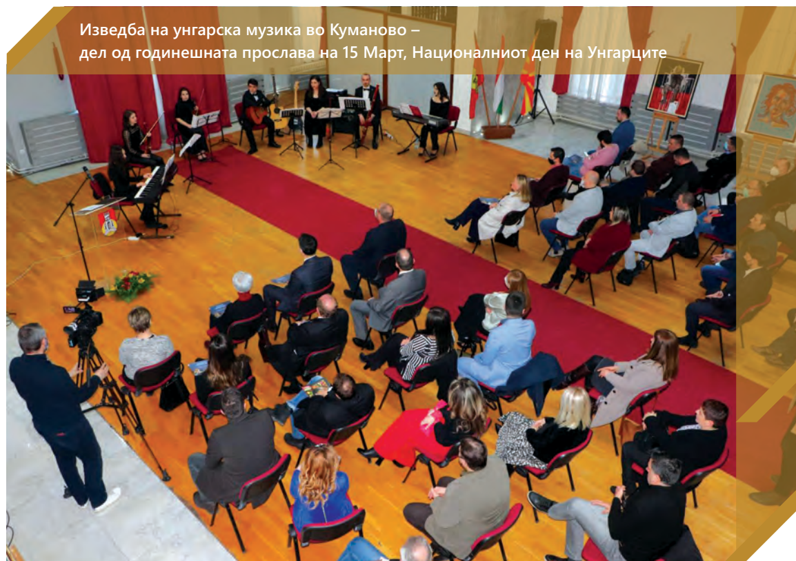
Изведба на унгарска музика во Куманово – дел од годишната прослава на 15 Март, Националниот ден на Унгарците

Унгарија ја поддржува евроатланската интеграција на земјата од нејзината независност. Го поздравуваме вашето пристапување во НАТО. Војната во Украина во моментов покажува колку беше тоа важно. Жалиме што процесот на пристапување во ЕУ е толку бавен и што секогаш има нови препреки на патот. Мислам дека вашата земја направи сè што можеше да го забрза овој процес и дека е сега до нас во ЕУ да ги преземеме потребните следни чекори.