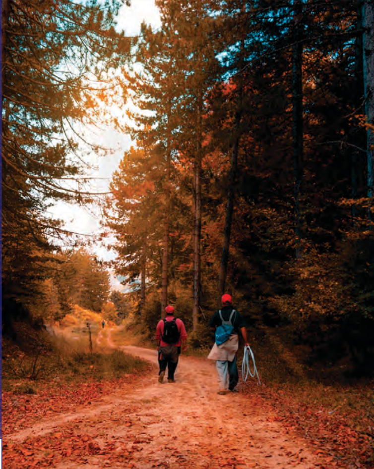
Пешачка патека во околината на Крушево