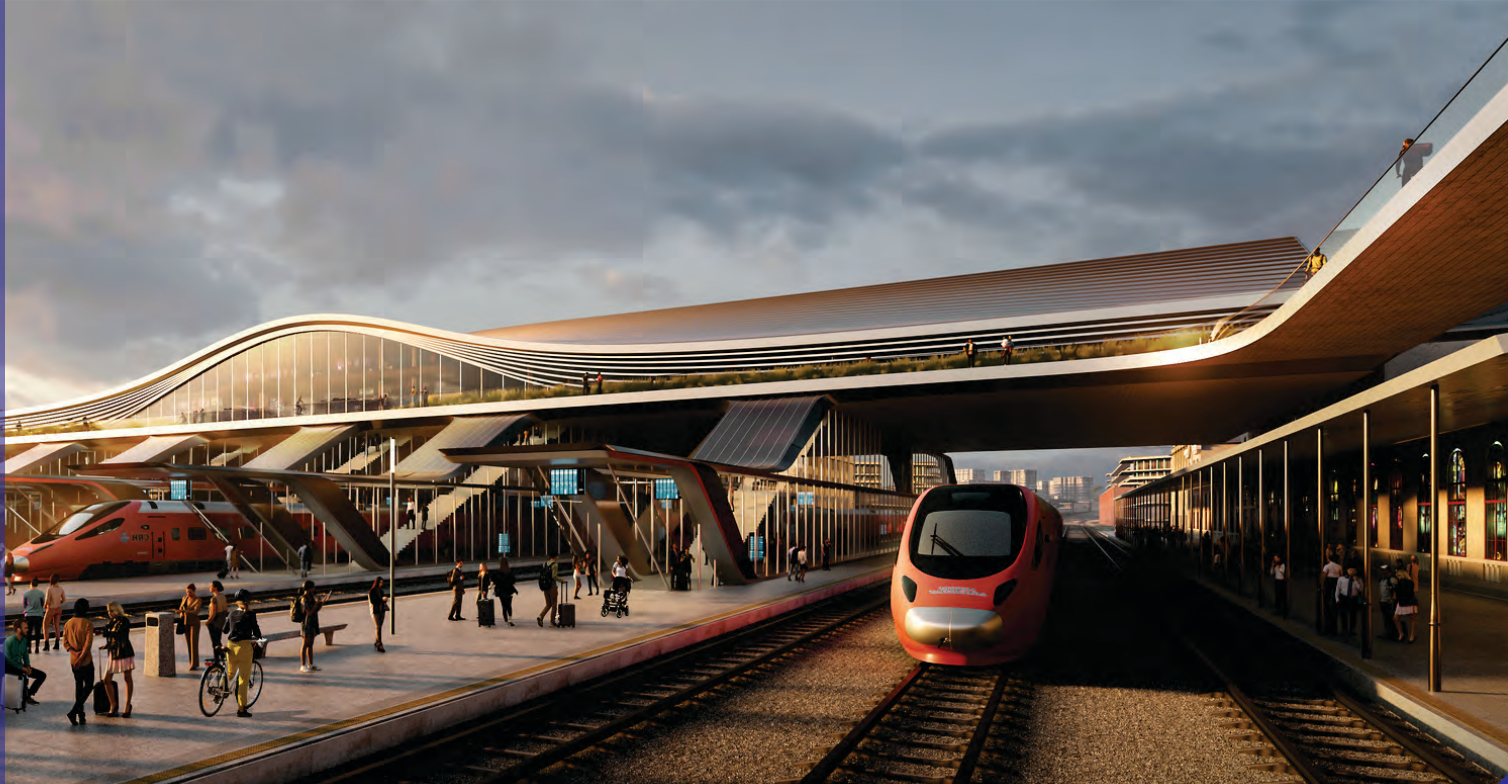
Железничка станица во Вилнус, Литванија