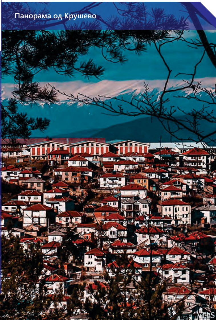
Панорама од Крушево

Младите од Крушево забрзано се иселуваат со децении наназад. Во градот и во околината, освен помалите поврзани со туристичко-угостителската понуда, речиси и да нема нова инвестиција што би ги натерала младите да останат овде и да придонесат кон обнова на родниот крај. Немањето понуди за работа очигледно си го зема данокот во Крушево. Иако голем дел од кадарот е ангажиран во угостителството, сезоната трае прекратко за да