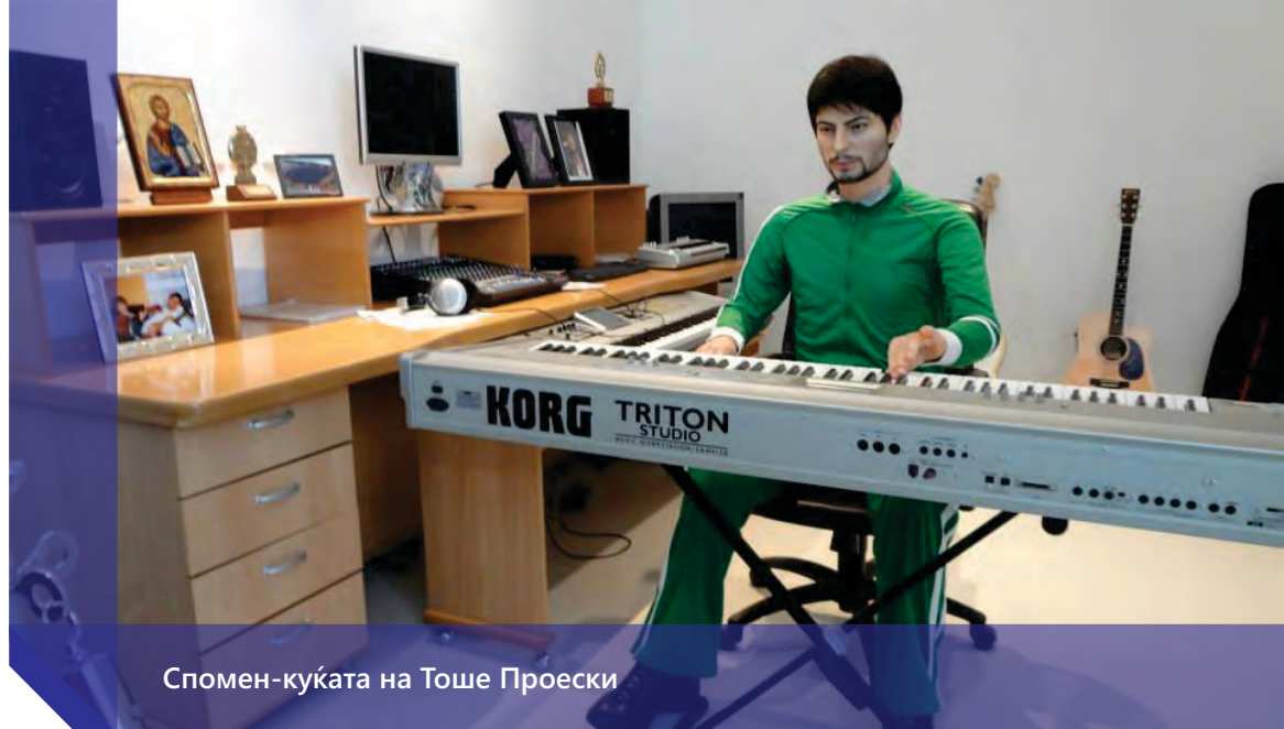
Спомен-куќата на Тоше Проески

и одржлива на долг рок. За почеток, Крушево е добро поврзано со патишта до другите градови, но тие се во лоша состојба. Иако се направија напори за санирање на делниците од Кривогаштани и Демир Хисар, градежните активности се одвиваат бавно. Речиси сите што одат кон градот го користат патниот правец од Прилеп. Само едната сообраќајна лента од регионалниот пат тешко дека може да го издржи напливот од возила лете кога има најголем метеж. Патот, пак, од Крушево до Демир Хисар е посебна приказна. Со години жителите од двата града и од околните места се жалеа дека делницата е полна со дупки и дека не може да се извозат ниту 100 метри без да се застане. Властите направија напори за реконструкција, но само половични.