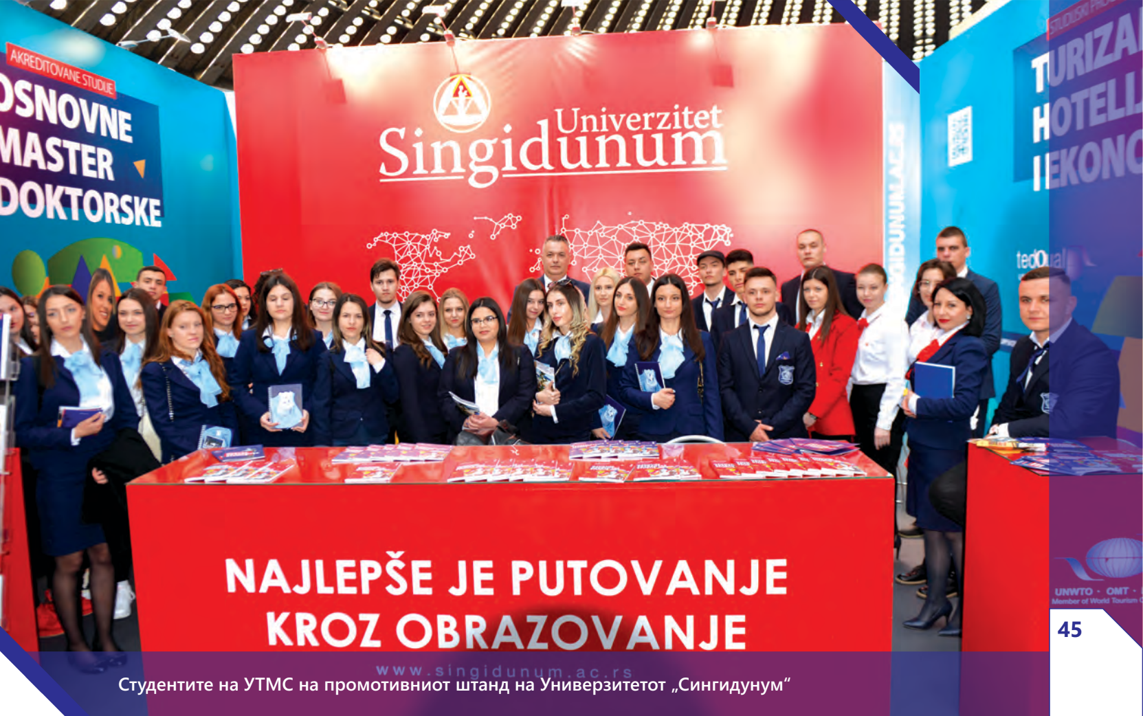
Студентите на УТМС на промотивниот штанд на Универзитетот „Сингидунум“