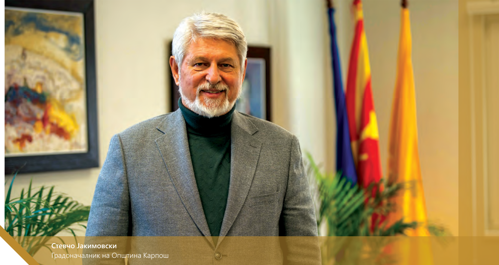
Стевчо Јакимовски Градоначалник на Општина Карпош