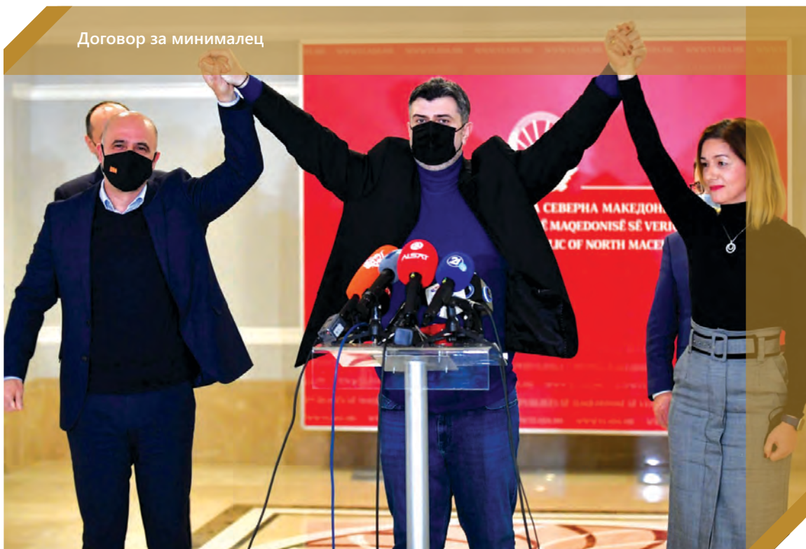
Договор за минималец

Голем дел од луѓето што се дел од туристичко-угостителскиот сектор се пријавени на минималец. Меѓу оние со најниски плати се вбројуваат и агентите за резервации во туристичките агенции, туристичките водичи, собарките, вработените во службите за перење, чистење и за пеглање во хотелите, келнерите, рецепционерите итн.