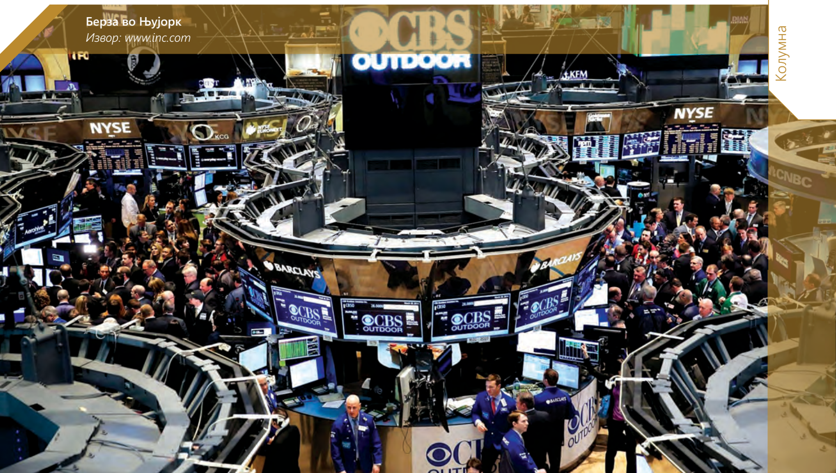
Берза во Њујорк

Во таков амбиент, реално е да се очекува стагфлација на националната економија.